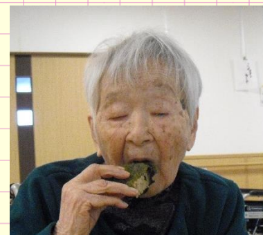
ちらしも食べようかな？