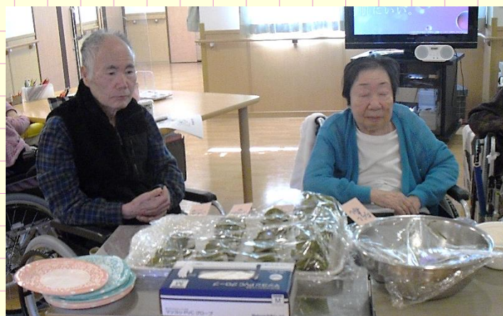
あれが美味しそうだな！ どれどれ？