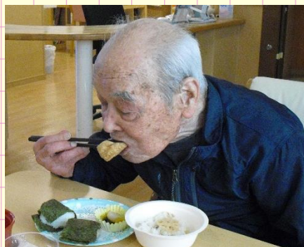
今日は10個食べるぞ!