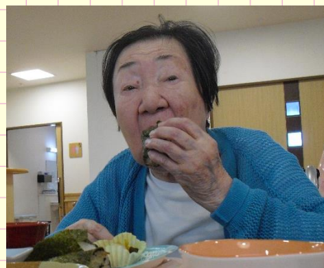
沢山取って来ちゃった！