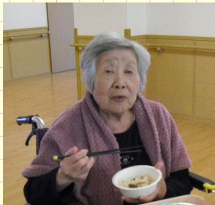
味がしっかり染みてるわね！