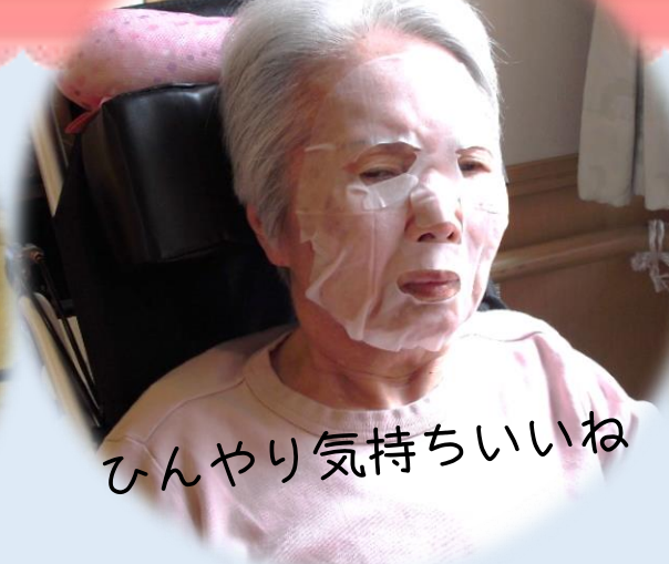
ひんやり気持ちいいね