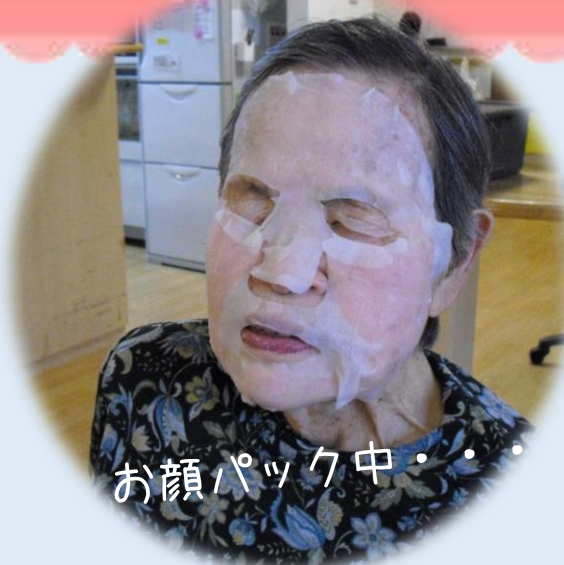
お顔パック中・・・