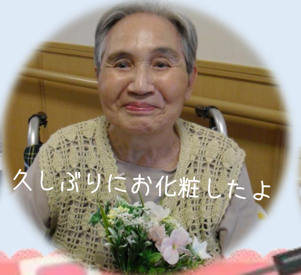
久しぶりにお化粧したよ