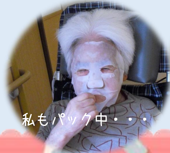
私もパック中・・・