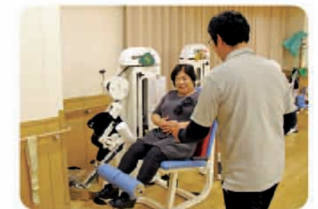
パワーリハビリの機器 写真はレッグエクステンション

また適切な栄養管理もリハビリに重要と考えおり、食と栄養に関する専門知識を持つ管理栄養士による、飽きのこないバラエティーに富んだ食事の提供をし、リハビリに必要な体力作りを心掛けています。