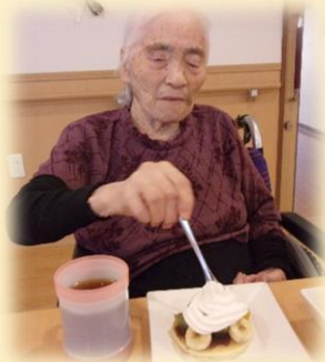
どれどれ、味はどうかな？