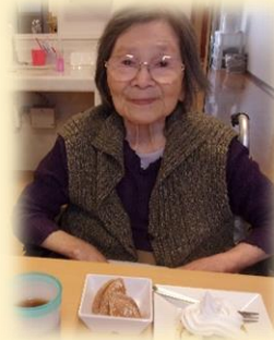
あら～、素敵なおやつね！