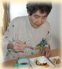
生クリームたっぷりね！