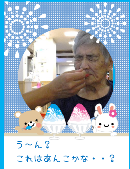
う～ん？ これはあんこかな・・・？