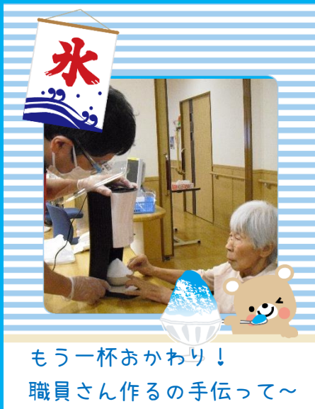
もう一杯おかわり！ 職員さん作るの手伝って～