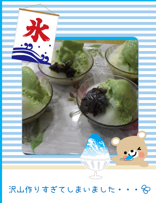
沢山作りすぎてしまいました・・・🐻