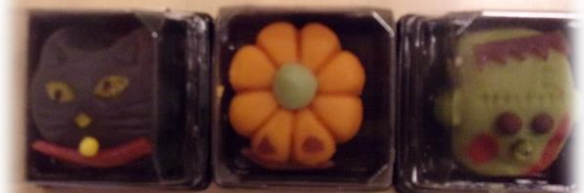
黒猫 カボチャ フランケン