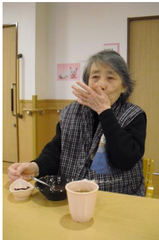
「甘くて美味しいよ」 「お替り貰おうかしら？」