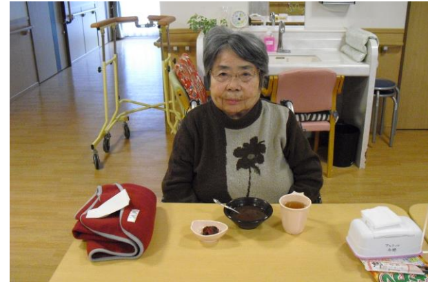
「体が温まって良いわね😊」