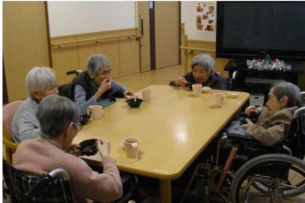
皆さん黙々と召し上がられています・・・。