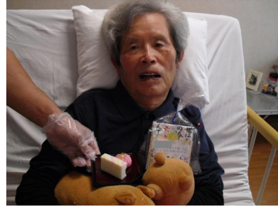
敬老の日おめでとうございます！