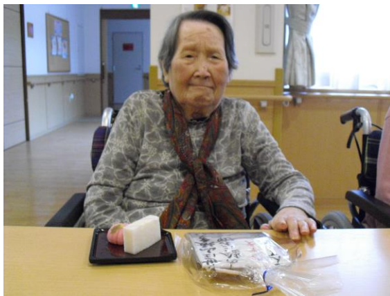
「ありがたく頂戴いたします」