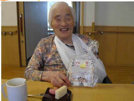
「プレゼントは嬉しいわ」