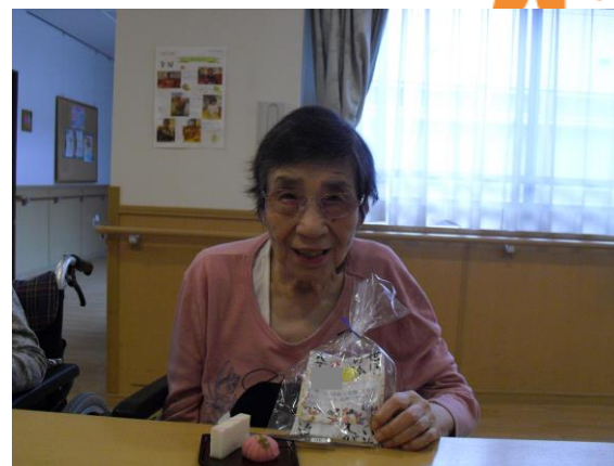
「戴着いいの？まあ嬉しい😊」