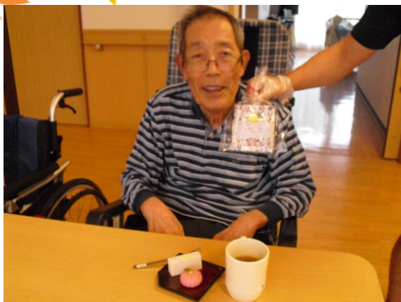
「大切にに使わせてもらいます」