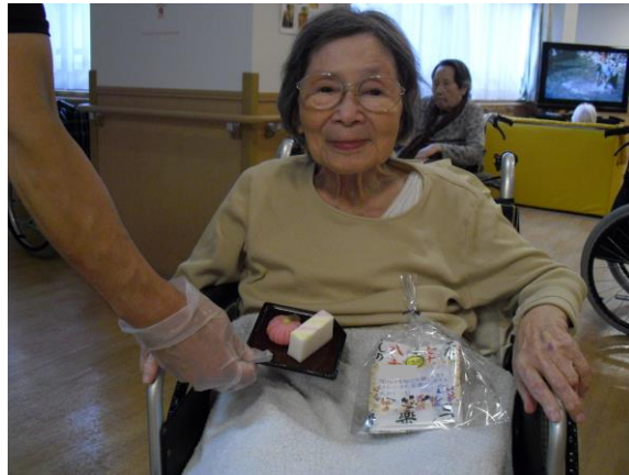
「ありがとう！嬉しいわ😊」