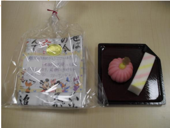
プレゼントと特別な和菓子です